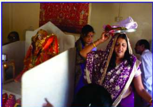
ધ્વજરોહણની પૂર્વ તૈયારી