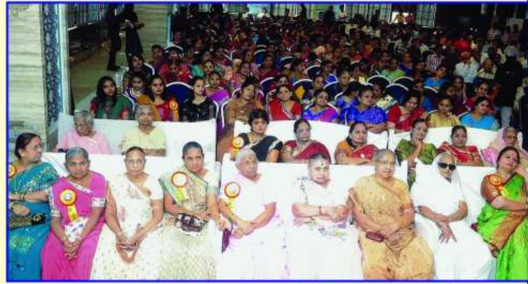
ઉપસ્થિત સ્ત્રી ગામવાસીઓ અને આમંત્રિતો