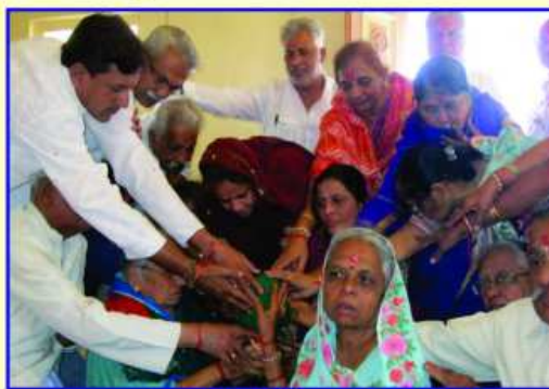
સંધ્યાપાઠ માટે કળશ સ્થાપન