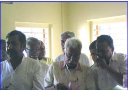
ધ્વજરોહણ પ્રસંગે ભક્તિભાવનામાં તરબોળ ભાવિકજનો