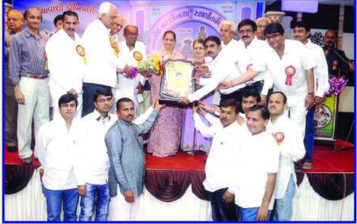
સમારંભ પ્રમુખ માતુશ્રી સરલાબેનનું સન્માન