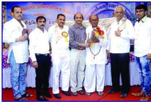
નલીયા મહાજનના પદાધિકારીઓનું સન્માન