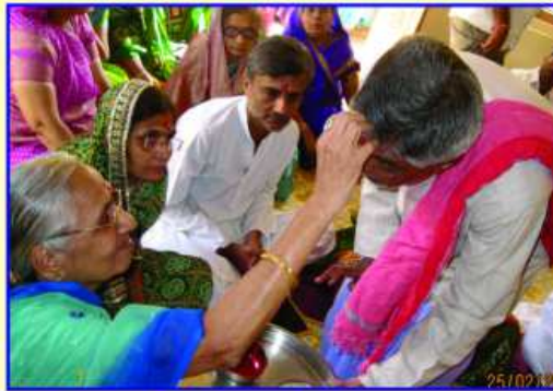
ચંડીપાઠ પૂર્વે વિધિકારને તિલક કરતા ભોઈમા