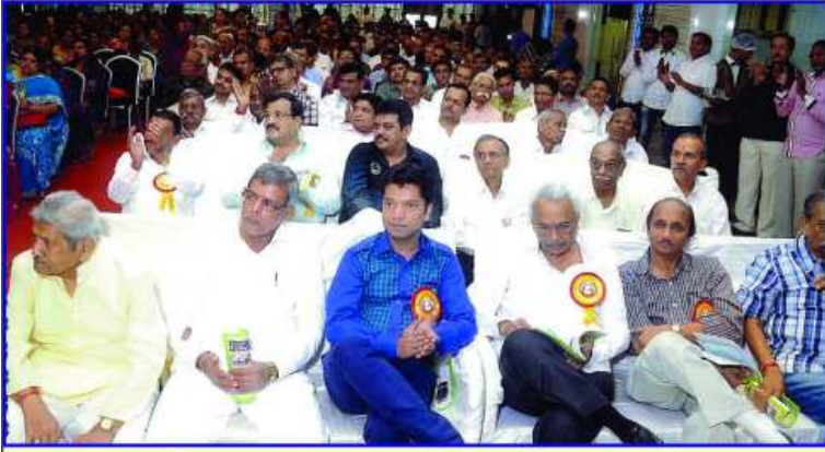
ઉપસ્થિત પુરૂષ ગામવાસીઓ અને આમંત્રિતો