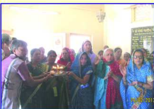
ધ્વજરોહણ પ્રસંગે આરતી ઉતારતા ભાવિકજનો