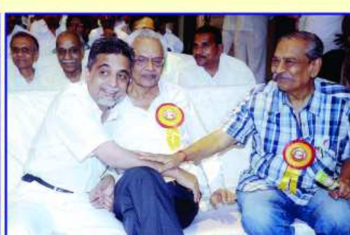
સ્નેહમિલન નિમિત્તે મહાનુભાવોની મોજ