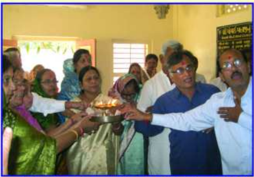
ચંડીપાઠ બાદ માતાજીની આરતી ઉતારતા ભાવિકો