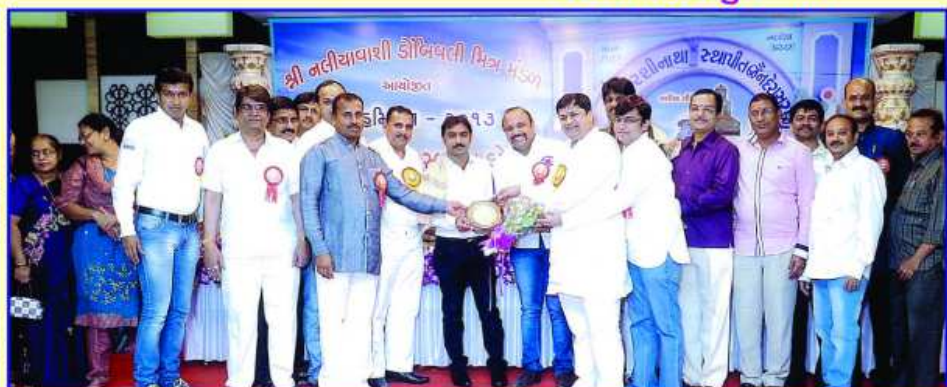
શ્રી ક.દ.ઓ. મંડળ ડોંબીવલીના આગેવાનોનું સન્માન