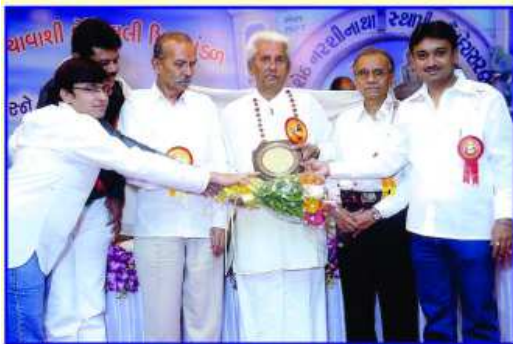
ચન્દ્રપ્રભ અતિથીગૃહના ટ્રસ્ટીઓનું બહુમાન