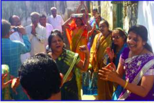
ચંડીપાઠના દિવસે થાળ લઈ જતા ભાવિકો