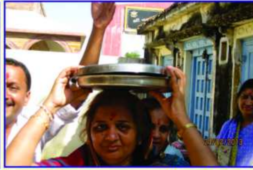
પૂ. માતાજીના થાળની તૈયારી