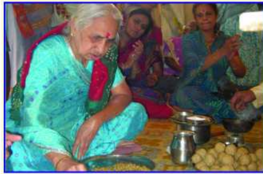
પૂ. માતાજીની પહેડી જુદારતા શ્રી ભોઈમા