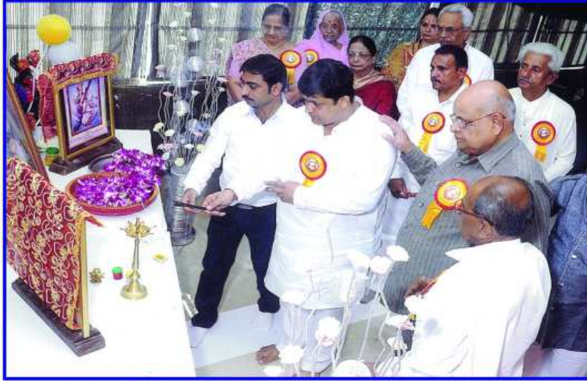
દીપ પ્રાગટ્ય કરતા મહાનુભાવો