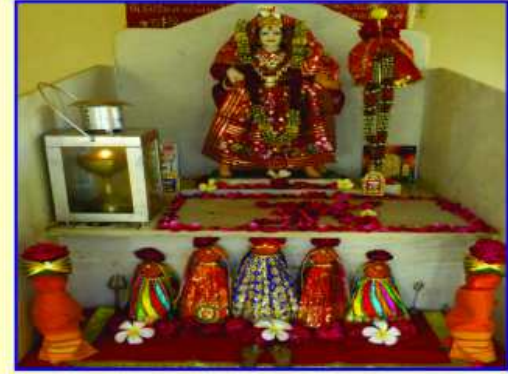
સ્થાનકે બિરાજમાન કુળદેવી શ્રી મોમાઈ માતાજીની મનમોહક પ્રતિમા