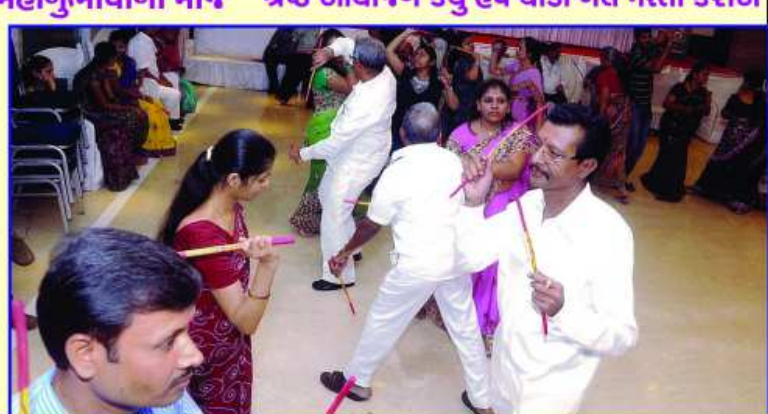
પારંપારિક બાર ઘાંડિયા રમતા જ્ઞાતિજનો