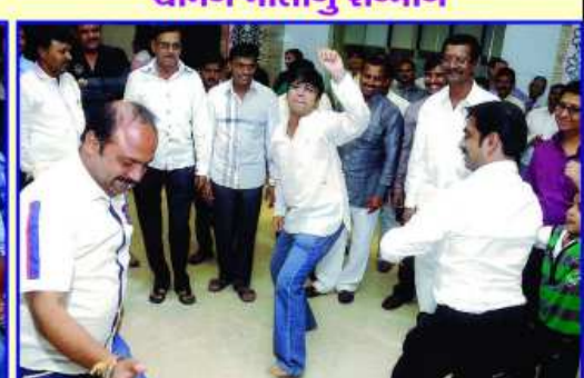
શ્રેષ્ઠ આયોજન કર્યું હવે થોડી ખેલ મસ્તી કરીએ