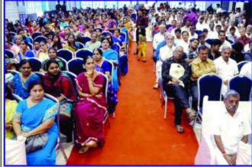
ઉપસ્થિત ગામવાસીઓ અને આમંત્રિતો