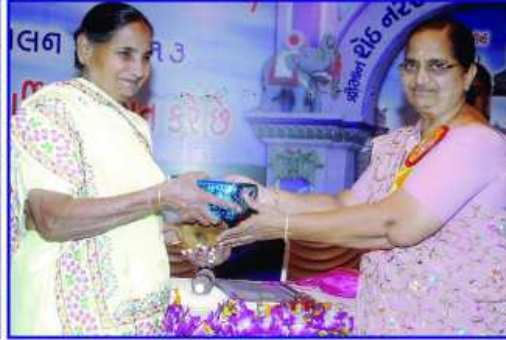
તપસ્વી બહુમાન કરતાં માતૃશ્રી સરલાબેન