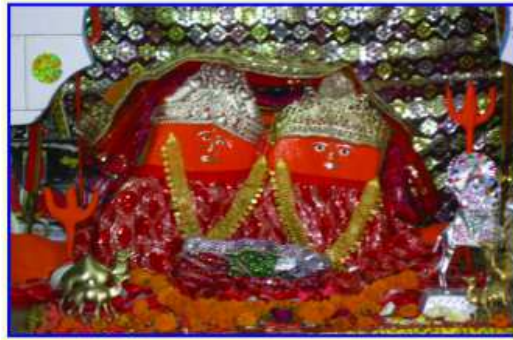
કચ્છમાં મુળ સ્થાનક મોમાઈમોરામાં બિરાજમાન શ્રી મોમાઈ માતાજી તથા શ્રી આશાપુરા માતાજી