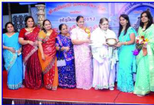
નલીનપુર નારી નિગમના પદાધિકારીઓનું સન્માન