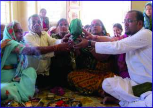
ચંડીપાઠ માટે કળશ સ્થાપન