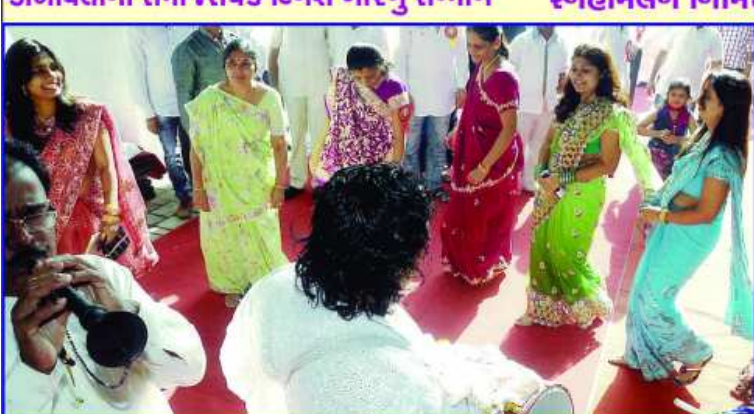
પારંપારિક કચ્છી રાસ રમતી બહેનો