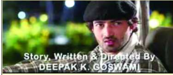
Story, Written & Directed By DEEPAK K. GOSWAMI