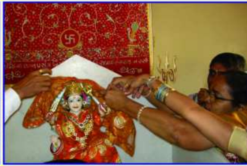
વરાડીયા સ્થાનકે શ્રી મોમાઈ માતાજીને ચુંડી ઓઢાળતા ભાવિકો