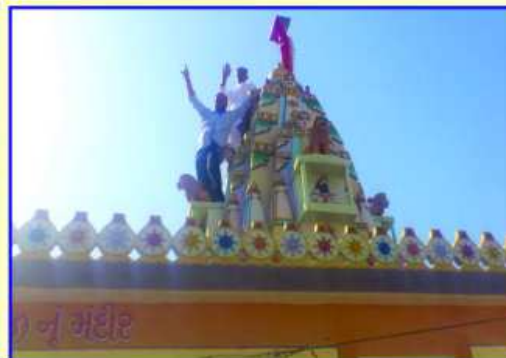
ધ્વજરોહણનો આનંદ માણતા ભાવિકો