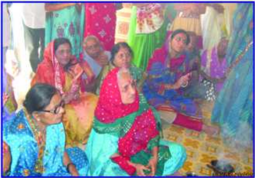
પહેડી દરમ્યાન ભક્તિભાવનામાં તરબોળ ભાવિકજનો